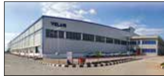
Coimbatore, Inde Velan Valves India Pvt. Ltd.