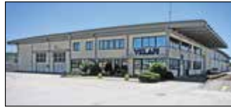
Lucca, Italie Velan ABV S.p.A., Usine 2