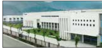
Suzhou, Chine Velan Valve (Suzhou) Co., Ltd.