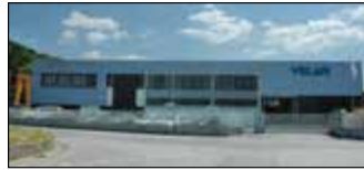
Lucca, Italie Velan ABV S.p.A., Usine 1