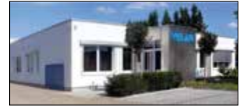
Willich, Allemagne Velan GmbH